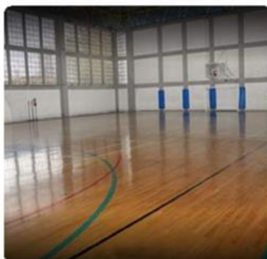
Foto da Quadra Poliesportiva da Escola Universitatis

UNIDADE – Associação Funcionários Cubatão, R. Dr. Olyntho Rodrigues Dantas, 80 - Encruzilhada, Santos - SP. *